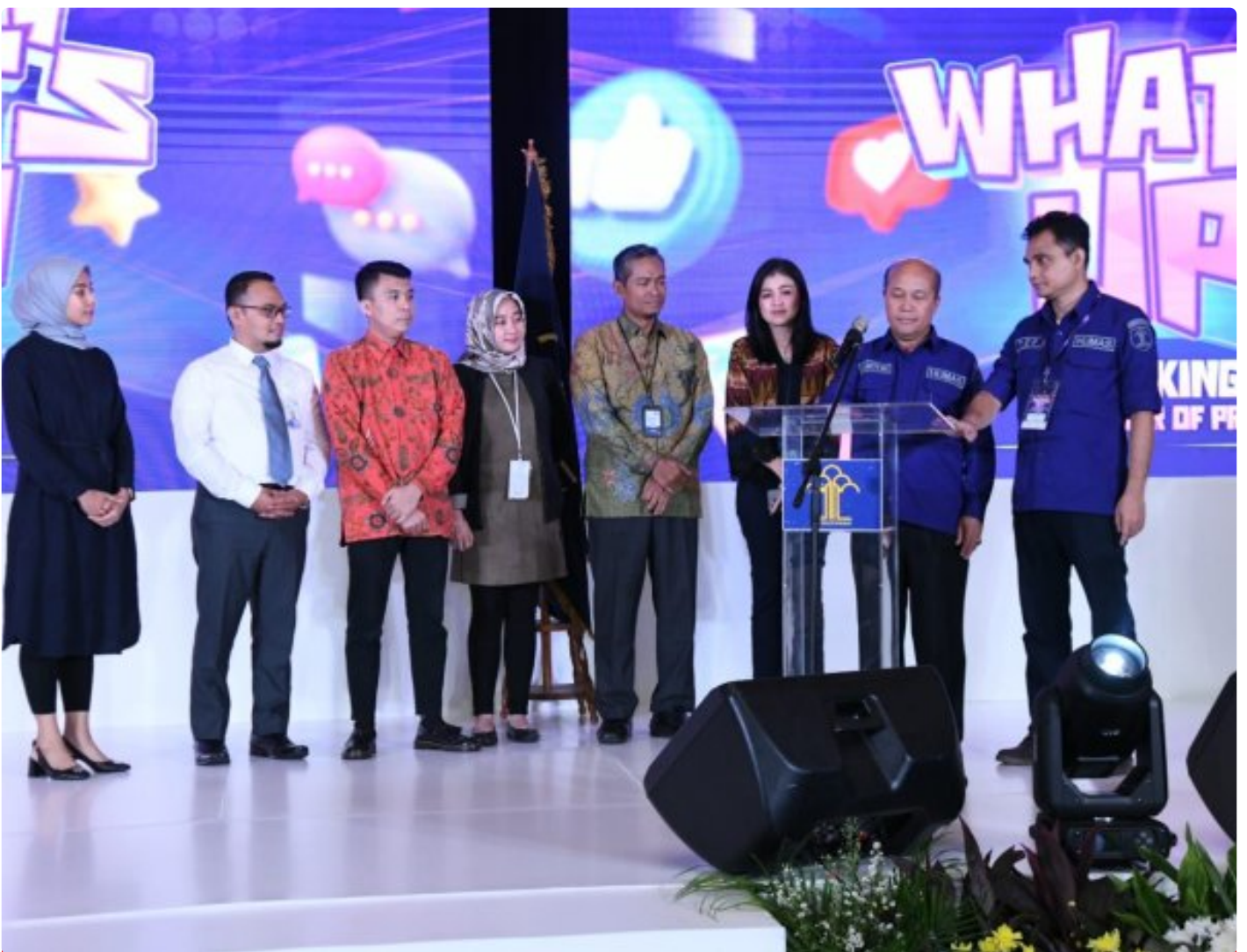
Humas Kemenkumham RI adakan Acara Bertajuk What's Up

JAKARTA - Kementerian Hukum dan Hak Asasi Manusia (Kemenkumham) menyelenggarakan kegiatan bertajuk "What's Up". Acara ini digelar sebagai upaya peningkatan kapasitas dan kompetensi insan humasnya.